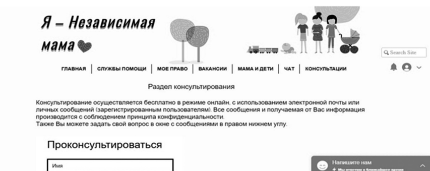
Рисунок 1. Модель ресурса «Я – Независимая мама»